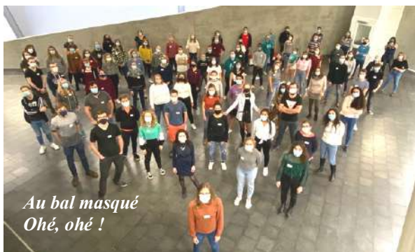
Au bal masqué Ohé, ohé !