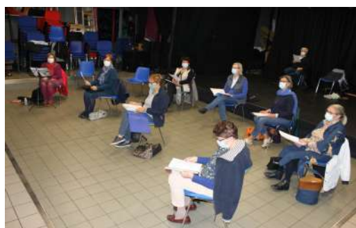
Sopranes deux en pupitre

Les alti et sopranes sont divisées en 2 groupes : un groupe d'alti et un groupe de sopranes chantent à la première heure.