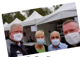
Staff au Forum

Nous avons toutefois participé au Forum des Associations Culturelles le 6 septembre dernier au port d'Épinal afin de recruter de nouveaux choristes.