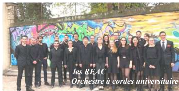
les REAC Orchestre à cordes universitaire