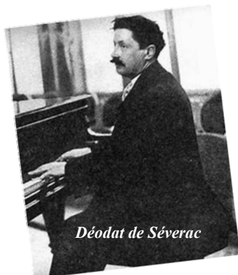
Déodat de Séverac

Le langage musical post-romantique de Fernand de la Tombelle est précis, développé et inspiré. Il est d'une grande qualité harmonique avec un sens mélodique très expressif. Destinant souvent ses œuvres à des sociétés musicales proches de là où il réside, il sait alors adapter son écriture aux capacités de ses chanteurs.