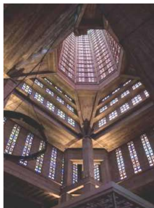
Eglise Saint Joseph

Le samedi soir, RIVAGES & VOYAGES a réuni pour un concert original les artistes du Havre: peintres, poètes, compositeurs, récitateurs et chœurs.