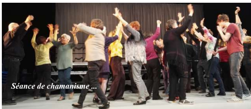
Séance de chamanisme ...