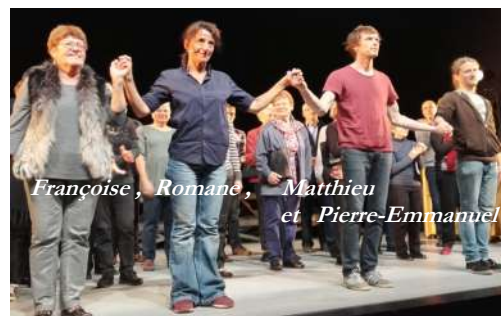
par Anne Lambert, choriste Ars Musica

Et maintenant, comment nous sentons-nous après ces Événements ? Heureux ? Fiers ? Prêts à recommencer ? Ce qui est sûr, c'est que cette expérience artistique et humaine géniale restera dans les annales de l'EVAM !